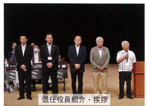
退任役員紹介・挨拶