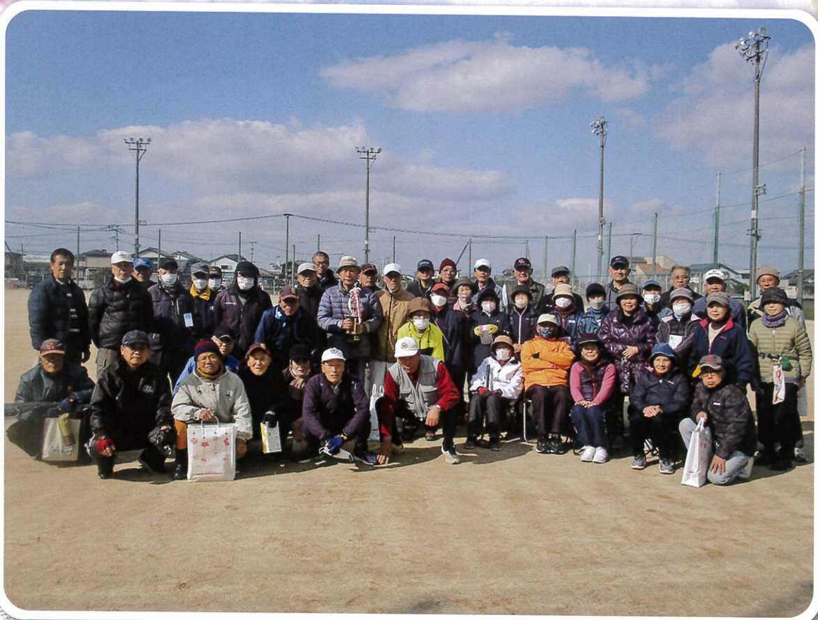
第12回 柳和会（会員互助会）グラウンドゴルフ大会集合写真