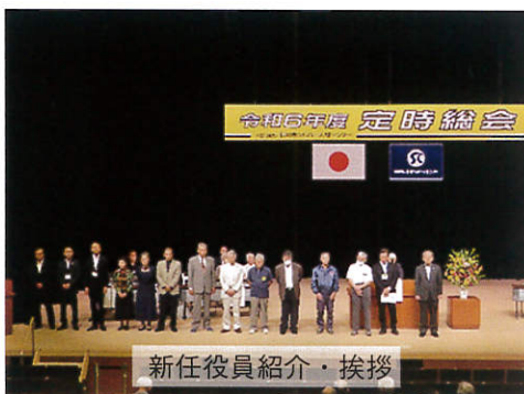
新任役員紹介・挨拶