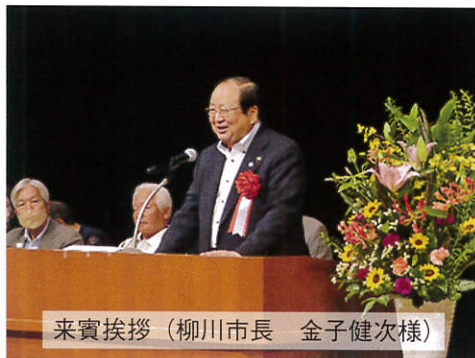
来賓挨拶 (柳川市長 金子健次様)