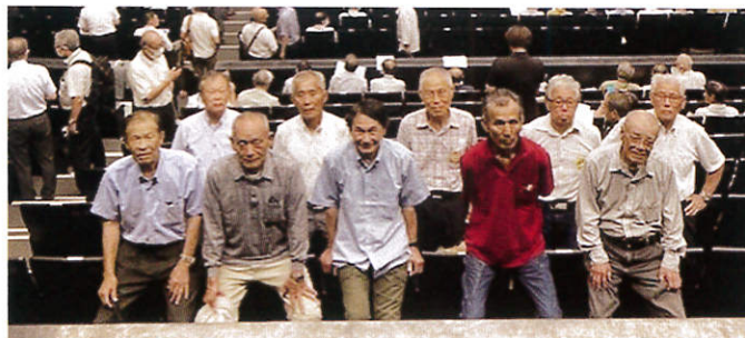
※令和6年度福岡県シルバー人材センター連合会 安全就業促進大会にて