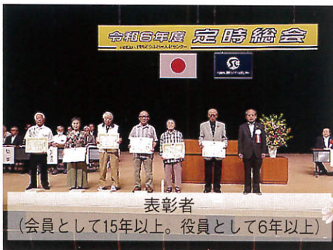
表彰者 (会員として15年以上。役員として6年以上)